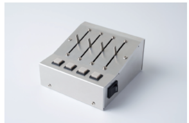
スライドボリューム